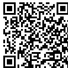
【地図用 QR コード】